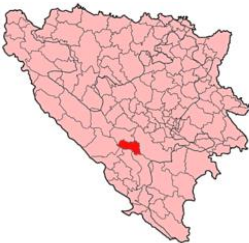
Slika 1. Geografski položaj Općine Jablanica

Po službenom popisu stanovništva iz 1991. godine, Općina Jablanica imala je 12.691 stanovnika, raspoređenih u 33 naselja. Poslije potpisivanja Daytonskog sporazuma Općina Jablanica, u cjelini, ušla je u sastav Federacije Bosne i Hercegovine.